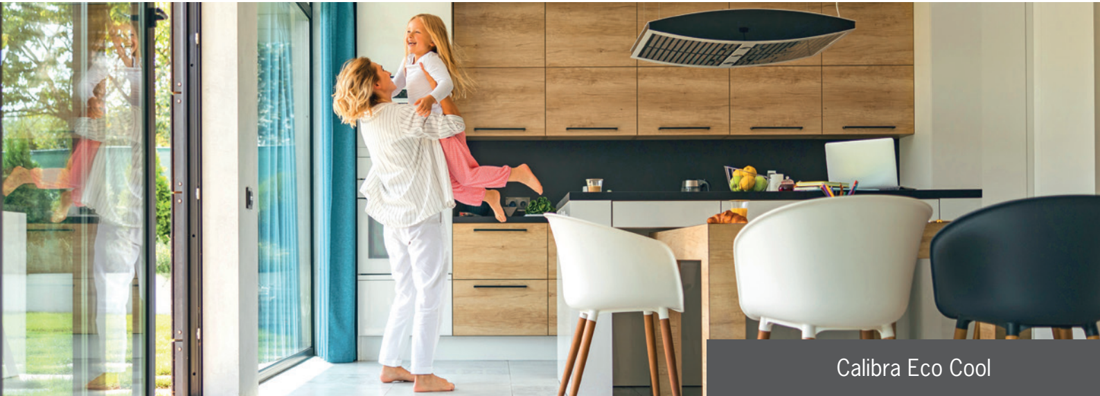
Calibra Eco Cool